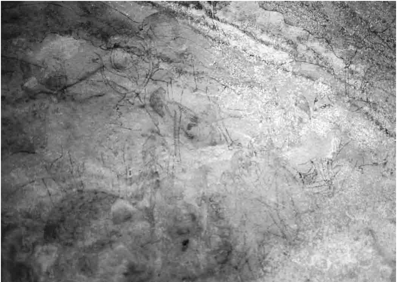
Fig. 7. La cerimonia funebre (?) di Tahilahi. pl. B.