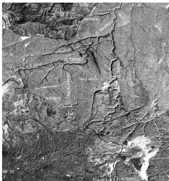
Fig. 2. Tassili-n-Ajjer nord orientale. Le posizioni di Iheren e Tahilahi sono stimate. Sulla foto satellite sono indicate la strada asfaltata Illizi-Djanet, con la deviazione per Iherir, e le piste per Imhirou e Ti-n-Terirt.