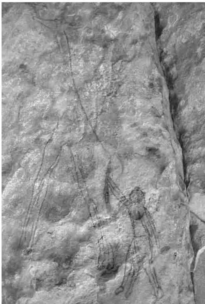
Fig. 9. Lo strano personaggio sdoppiato che infila le braccia destre tra le natiche di una giraffa. pl. C.

ti piuttosto di una cerimonia funebre perché: 1) sull'individuo sdraiato non si riconoscono assolutamente i seni; 2) una raffigurazione di parto è altrettanto inusuale quanto una funebre; 3) la pittura suscita un sentimento di malinconia; 4) non si vede il neonato; 5) nelle attuali popolazioni africane, la posizione supina non è usuale durante il parto. Riconosciamo che il punto 3 è molto soggettivo e che il neonato potrebbe essere rappresentato, non più visibile, fra i personaggi di destra accanto al bambino. Altri elementi di questa grotta possono però aiutare ad interpretare questa scena.