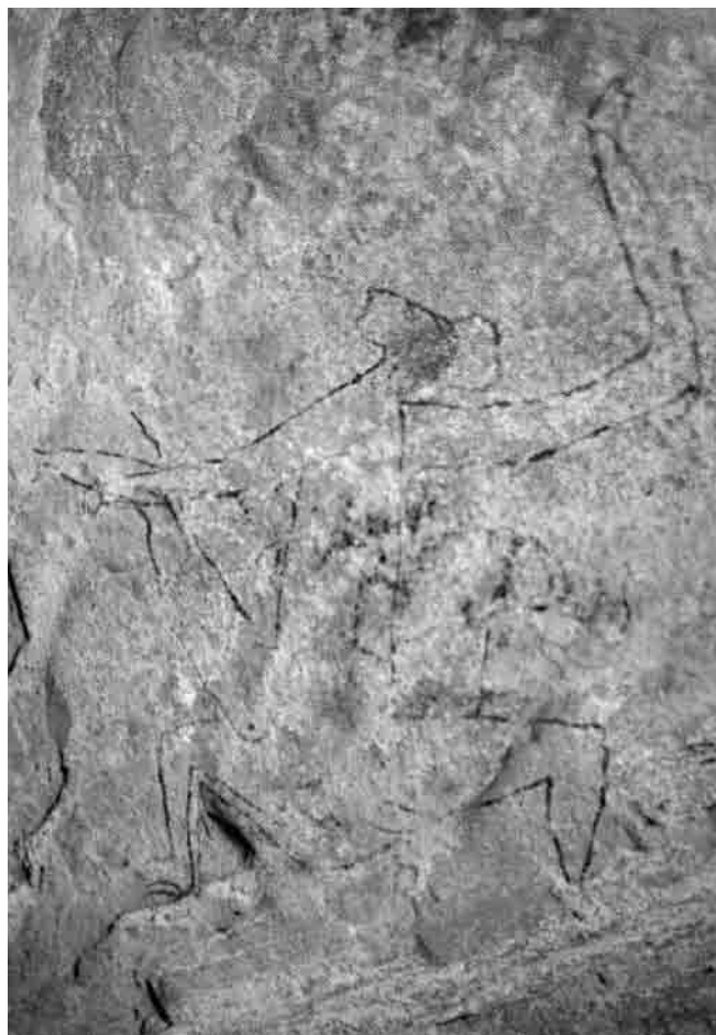
Fig. 6. La scena a carattere sessuale esplicito. pl. A.