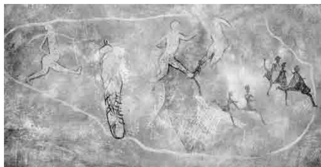
Fig. 1. UanMuggiag (da: Mori, 2000).

L'elefante nero [2], le zampe ed i colli degli struzzi in corsa (Fig. 4) sono le prime forme che si riescono ad individuare ma poi appaiono personaggi straordinari, animali selvaggi, mandrie e greggi dipinti con grande naturalismo e cura. A proposito dei quattro individui dipinti a fianco dell'elefante (Fig. 5), Malika Hachid (2000:69) scrive: «Notez, ici, les peintures faciales, de véritables arabesques, le bonnet enserrant la tête et laissant s'échapper, vers le haut, une touffe de cheveux raides ou une houpe (...). Les deux mains écartées, posées sur le sol, le personnage de droite a le corps penché vers l'avant, exactement comme un sprinteur actuel ferait pour prendre le démarrage d'une course de vitesse. L'arc (che il