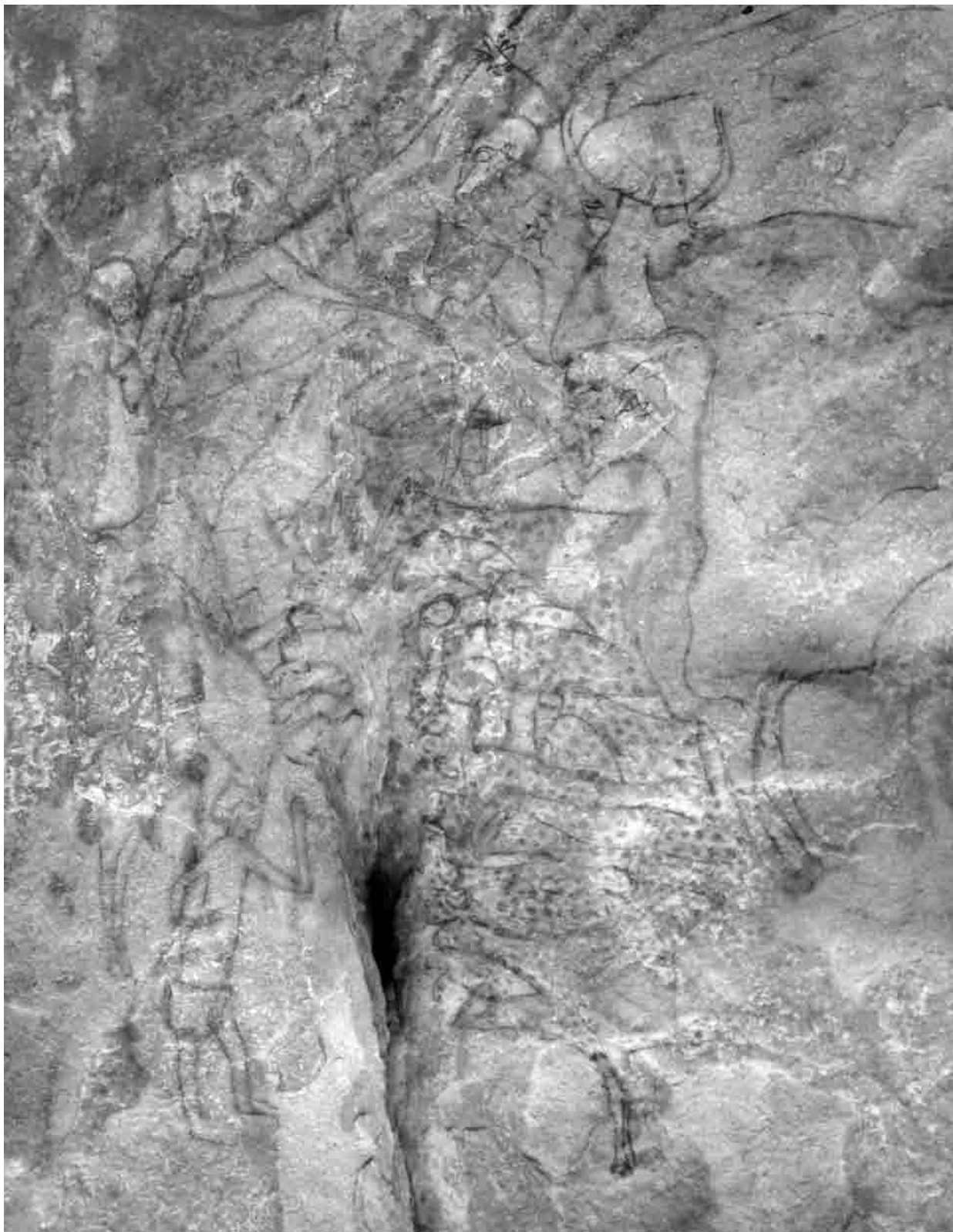
Fig. 10. L'abbeverata di Tahilahi. Sopra al gregge, punteggiato, si vedono alcuni bovini. A sinistra della fessura si riconosce un pastore. pl. D.