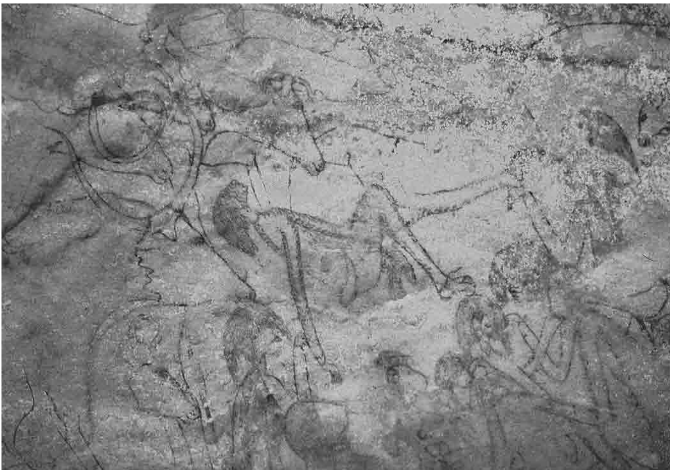
Fig. 8. Elaborazione digitale della Fig. 7.