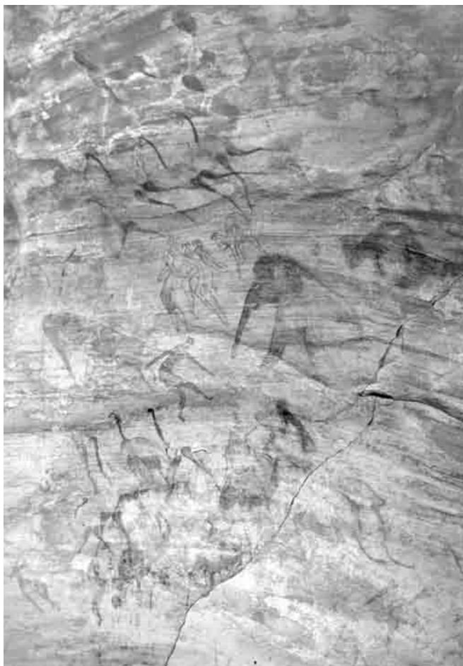
Fig. 4. La scena attorno all'elefante di Tahilahi.