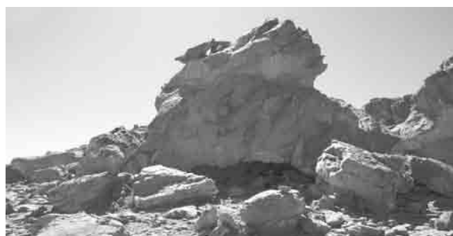
Fig. 3. La grotta di Tahilahi.