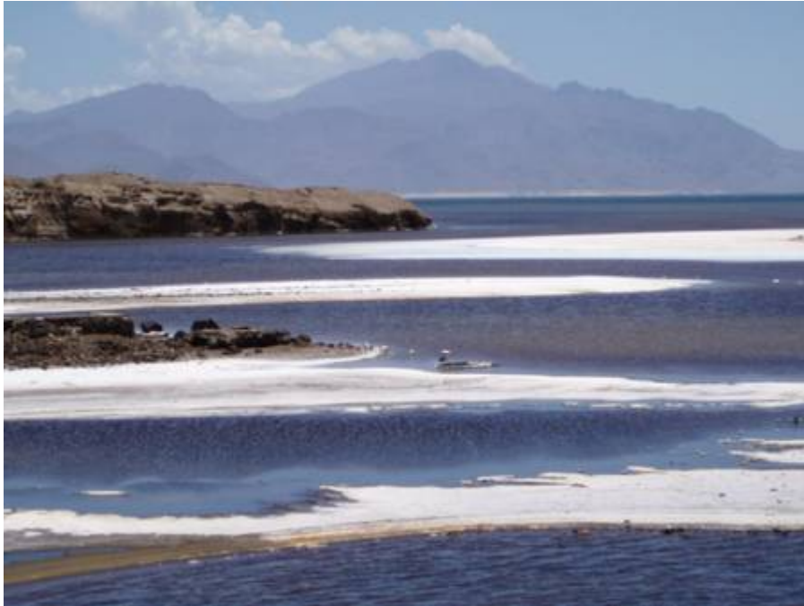
Le lac Assal de la république de Djibouti. Pendant la crise messinienne, une large part de la Méditerranée devait avoir le même aspect.

Aujourd'hui, les chercheurs ont découvert le lit d'un ancien fleuve comparable en importance au Nil, caché sous des dépôts éoliens entaillant les grès de l'est de la Libye sur près de 1.200 km.