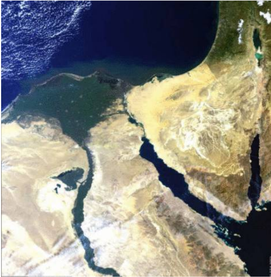
Le delta du Nil.